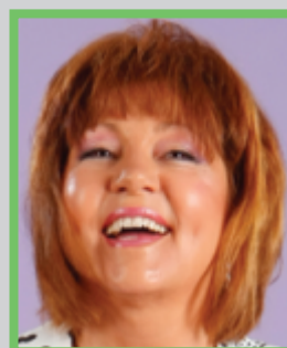
Zeid Andersson Kroppsspråk – Härskar- tekniker – Genus - Kommunikation

Anmäl dig via din sponsor på www.kunskapsdagarna.nu – idag!